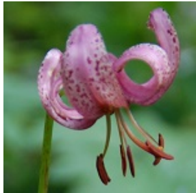
Türkenbundlilie ( Lilium martagon ):

Diese beeindruckende Pflanze steht inzwischen kurz vor der Blüte: die einem türkischen Turban ähnelt! Sie verströmt abends und nachts einen Duft, der Falter wie das Taubenschwänzchen zur Bestäubung anlockt. Ein anderer Name ist Goldwurz und bezieht sich auf die goldene Zwiebel, mit der Alchimisten glaubten, unedles Metall in Gold umwandeln zu können.